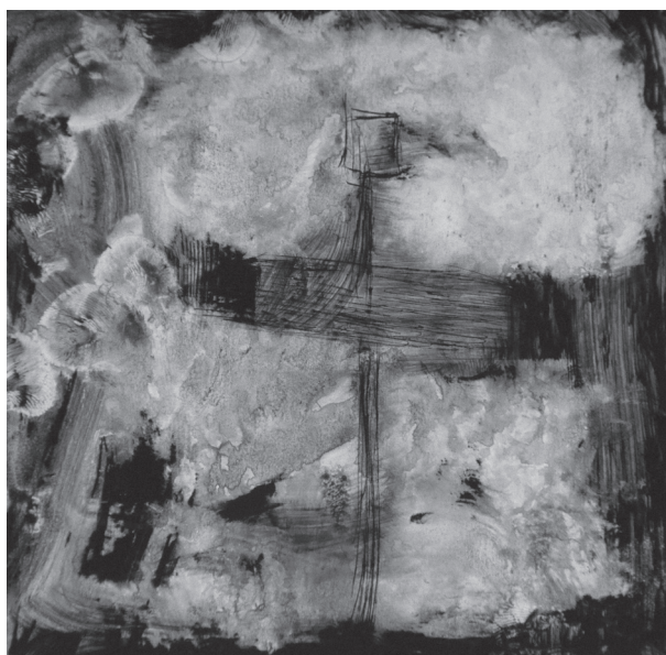
Figuras: 4, 5 y 6. Taller Diseño Gráfico e[ad] 2015. Grafías de la ciudad. Monocopia y punta seca sobre papel estucado, alt. 17 cm.