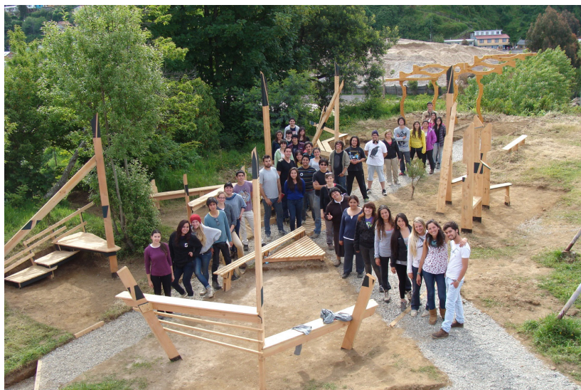
Figura 1. Participantes Taller de Primer año de Diseño 2012; lugar de la obra de Travesía: costado de la Parroquia de Corral. Imagen: grupo de registro Travesía 2012.

La obra comienza al definir el lugar a intervenir, este es en los terrenos de la Parroquia de Corral, a un costado de la Iglesia junto a una cancha multiuso, es un espacio baldío sin uso definido. Lo primero que se hace es despejar y preparar el terreno, así se tiene un panorama más claro de las dimensiones del espacio y sus elementos circundantes.