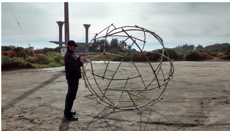
Figura 5. Elementos de coligue curvados a fogo.