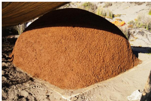
Figura 1. Transporte do molde de PVC até o local de construção e confecção do molde de areia.