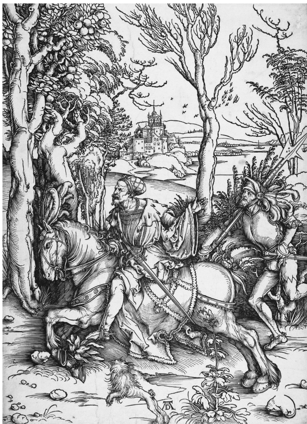
3. Dürero, “El caballero y el soldado”. Xilografía 1497, 38.2 x 27.7 cm

El carácter orgánico de estas invenciones sobre la luminosidad gráfica, planteadas por Dürero en sus grabados se transforman en verdaderas lecciones, cuando se presentan en el ejercicio de copiar los grabados. Ello permite a los estudiantes experimentar la virtud que trae consigo dibujar de una manera específica, siguiendo Panofsky, para salvar la distancia “entre un dibujo a la pluma y el diseño de un grabado”. Estas formas de estudiar la manera en que Dürero diseña sus xilografías, constituyen un tipo de experiencia sobre lo potencial del dibujo, cuando se lo encuentra en el origen de un diseño y