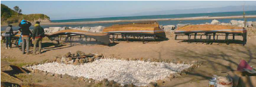
Figura (j) A obra entregue aos moradores.

A obra tornou-se um lugar de encontro com vistas para o Pacífico, um ponto de intercâmbio entre a cidade e a praia.