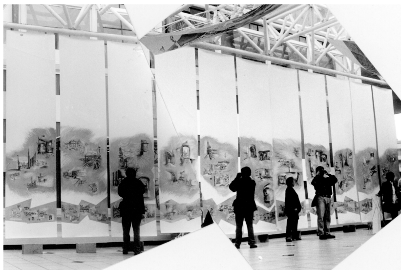
7. Grafías de la ciudad. Travesía a Quito. 1997. Punta seca sobre papel Kimdura. 4 x 12m.

En la Travesía a Quito, tal planteamiento, condujo a convenir en una forma de dibujar que tiene como condición definir un carácter, acorde a la instancia pública en la que nos encontramos, la cual permitió pasar de “mis dibujos” a un dibujo hecho por todos. Ahí lo que se definió es la especificación de un “instrumento único de dibujo” para todos de modo que cada dibujo, valioso en sí mismo pudiese ser traducido a un lenguaje común.