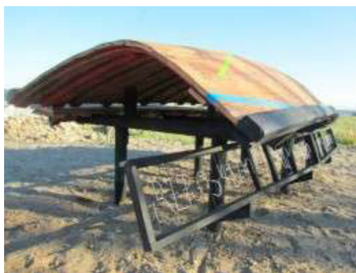
Figura (i) Obra executada.

Todo objeto constrói sempre uma relação com a vida. O casco de um barco é a forma viva de sua relação com o mar, mas, quando visto em terra, entende-se que está fora do lugar e parece abandonado.