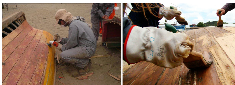
Figura (k) Polindo o material.

Nos barcos destruídos pela catástrofe, a madeira foi compreendida como material reutilizável. Sua beleza revela-se por sua pertença ao mar mesmo esfacelada, pelas curvas duplas que mostram a fineza do trabalho dos carpinteiros e pela existência dos pescadores que se reconhecem em algumas histórias desses barcos. São as dimensões próprias do lugar que desenharam a narrativa da forma da obra.