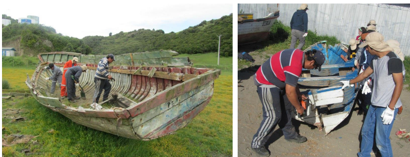
Figura (h) Os barcos cedidos.

São poucos objetos de madeira resgatados dos cascos dos barcos destruídos pelo tsunami. Cinco barcos foram disponibilizados para serem seccionados para obter pranchas em curvas duplas de cipreste. As secções de cinco metros de comprimento por dois metros de largura, em média, foram unidas e distanciadas do chão.