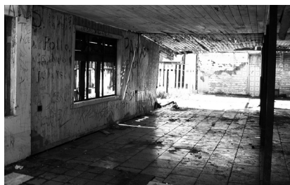
Figura (a) Praia e vila de Tubul.