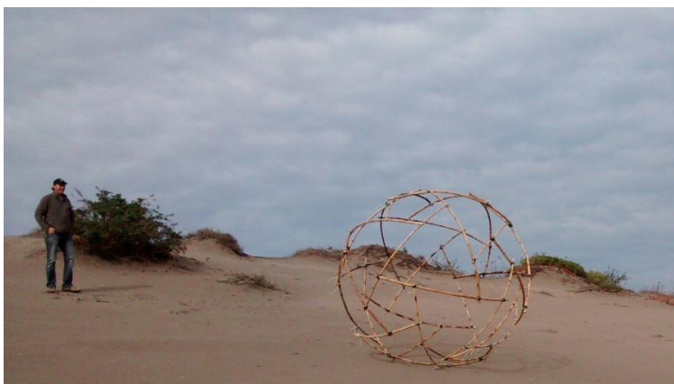
Figura 7. Objeto sendo rolado nas dunas da Ciudad Abierta .

O objeto comportou-se muito bem, no entanto, um melhor desempenho relativo à flambagem não fora obtido. Apesar de o coligue ser maciço em seu interior, essa parte interna apresenta uma densidade muito menor que a parte da casca, não apresentando uma diferença notável em relação ao bambu trabalhado no Brasil. Fora esse ponto, o objeto mostrou comportamento muito parecido com seu similar em terras brasileiras.